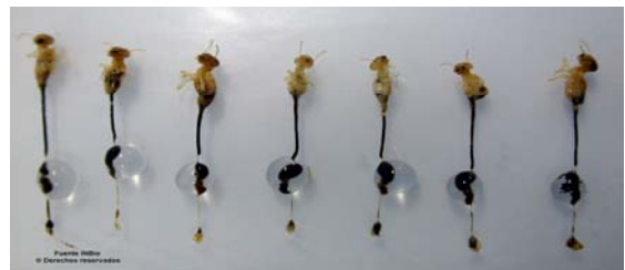
Varias termitas obreras adultas a las cuales se les han extraído su intestino

El convenio con INBio-DIVERSA ha permitido el trabajo con una importante variabilidad de muestras y en la actualidad el interés es concentrar los esfuerzos en la búsqueda de enzimas que permitan acelerar los procesos de degradación de la celulosa, particularmente de aquellos que tienen como propósito la producción de etanol a partir de materia orgánica. Durante los últimos años Diversa en asocio con el INBio, el Joint Genome Institute (JGI) del Departamento de Energía (DOE por su acrónimo en inglés) y del Instituto de Tecnología de California (CalTech) por su acrónimo en inglés, se ha focalizado en desarrollar tecnología para producir azúcares fermentables a partir de residuos celulósicos. De ahí el interés de obtener material genético de la flora bacteriana del intestino de termitas, a partir del cual ya se han obtenido algunos resultados promisorios que se espera generen en el futuro, no sólo beneficios monetarios para el país sino productos que permitan apoyar los esfuerzos del mundo en la búsqueda y el uso de alternativas a los combustibles fósiles.