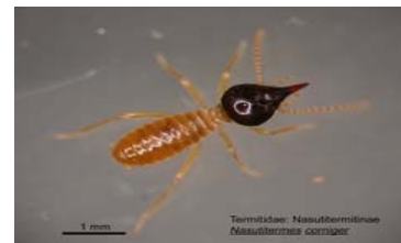
Soldado adulto de termita