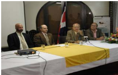
Mesa principal (de izquierda a derecha):

La suma total por las primeras ventas ascendió a $5.761,45 (unos 2,7 millones de colones). Además de estos beneficios monetarios, la compañía ha brindado capacitación a científicos del INBio, proveído el equipamiento y transferido la tecnología requerida para las actividades que se desarrollan en el Instituto.