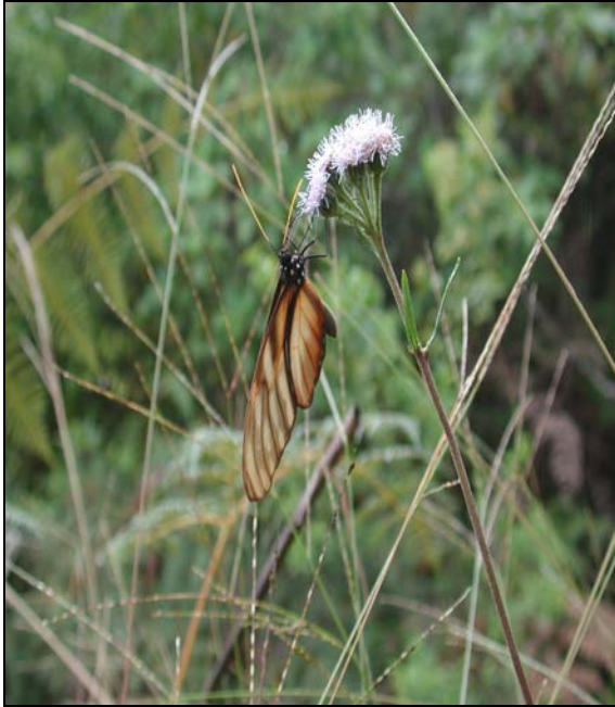
Ageratum chiriquense (Asteraceae)

Plethodontidae; en insectos se recolectó un escarabajo de la familia Scarabeidae, Onthophagus dorsipilulus , que es nuevo registro para el país, y una mariposa, Euptychia hilara , que solo se conocía del espécimen original.