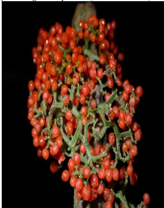
Urera sp. nov. (Urticaceae)

Elaborado por el proyecto de la Iniciativa Darwin 'Herramientas básicas para el manejo del Parque Internacional La Amistad (PILA): Costa Rica/ Panamá.