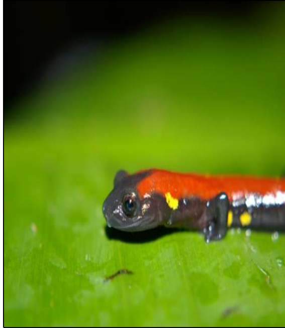
Bolitoglossa sp. nov. (Plethodontidae)