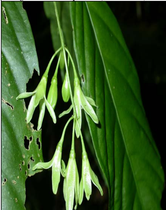
Cuatresia sp. nov. (Solanaceae)